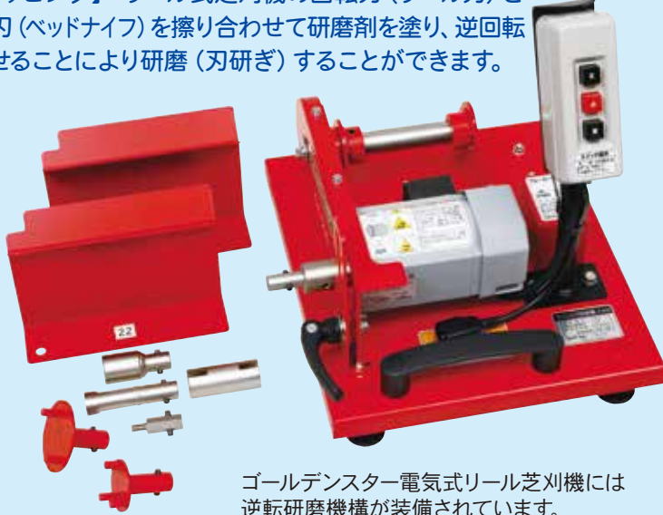
ゴールデンスター電気式リール芝刈機には逆転研磨機構が装備されています。 (機種により装備されていないものも一部ございます)

【ラッピング】 リール式芝刈機の回転刃（リール刃）と受刃（ヘッドナイフ）を擦り合わせて研磨剤を塗り、逆回転させることにより研磨（刃研ぎ）することができます。