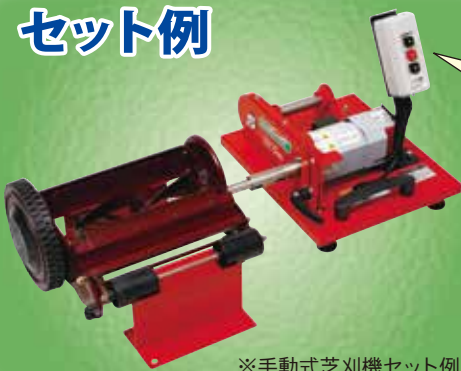
※手動式芝刈機セット例